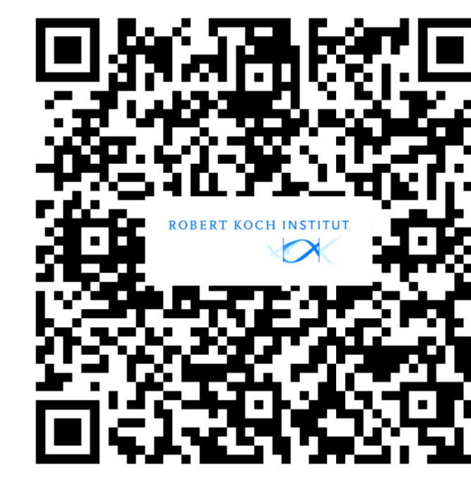
Weitere Informationen RKI