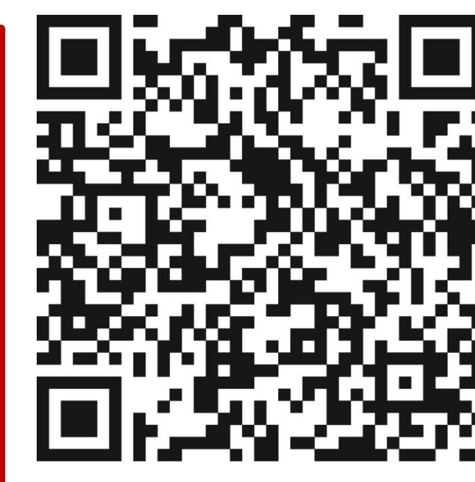
Weitere Informationen BZgA

Hotlines zum neuen Coronavirus Bundesministerium für Gesundheit: 030 346 465 100 Unabhängige Patientenberatung Deutschland: 0800 0117722 Patientenservice: 116 117