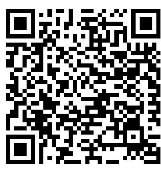
**Corona-Regelungen in den Bundesländern

Hotlines zum neuen Coronavirus Bundesministerium für Gesundheit: 030 346 465 100 Unabhängige Patientenberatung Deutschland: 0800 0117722 Patientenservice: 116 117