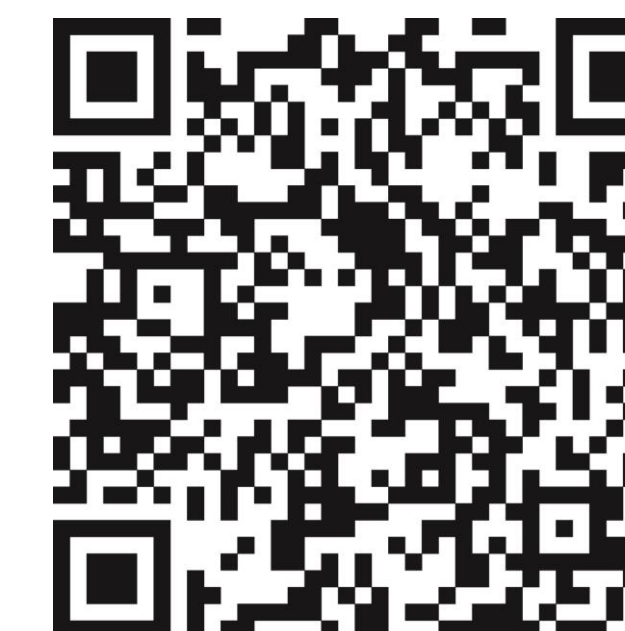
Weitere Informationen BZgA

Hotlines zum neuen Coronavirus Bundesministerium für Gesundheit: 030 346 465 100 Unabhängige Patientenberatung Deutschland: 0800 0117722 Patientenservice: 116 117