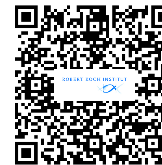
Weitere Informationen RKI